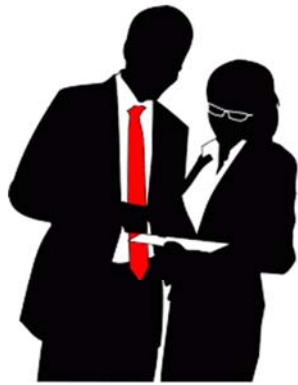
Männer und Frauen